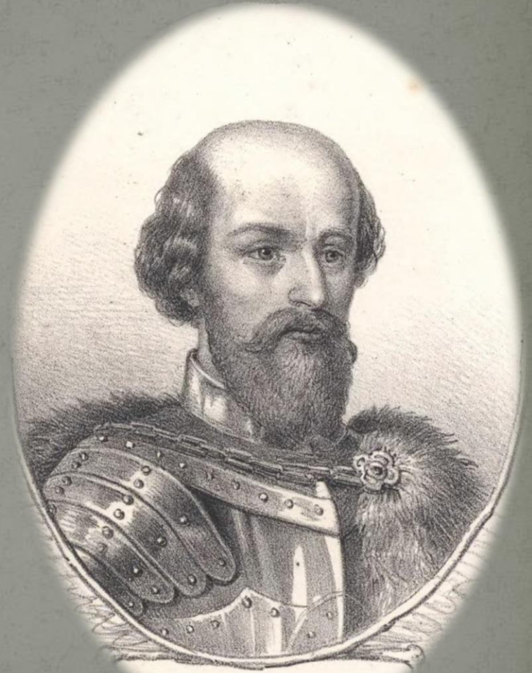
Matouš Trenčiansky † 1320